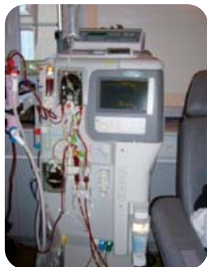
Modèle « Integra » du laboratoire Hospital